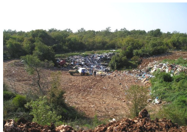
“Sanirano odlagalište” – zatrpano zemljom