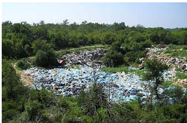
Primjer ilegalnog odlagališta